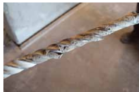
Prøveboring foretaget, hvor ikke-destruktiv måling har lokaliseret dårlig udstøbning. På det viste 12 mm bor ses våd/fugtig mørtelmateriale og ikke tørt borestøv

byggerierne er fejlbehæftede. Det er måske ikke alle elementer, som har været frostpåvirkede og dermed "testede". Derfor er der blevet iværksat undersøgelser, hvor FORCE Technology har lokaliseret fejludstøbninger med avanceret ikke-destruktivt måleudstyr for at lokalisere rør, hvor udbedring var nødvendig. I nogle sager er der endvidere foretaget en skadesudredning.