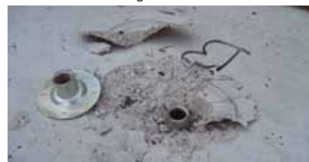
Brud i insert som følge af trækprøvning.

FORCE Technology udfører også forsøg til bestemmelse af forskydningsstyrken, undersøgelse af stålqualiteten brugt til fremstilling af inserts, samt alle andre former for test af inserts kunden måtte ønske. Vi laver desuden også test af bjergankre og anden form for forankringer.