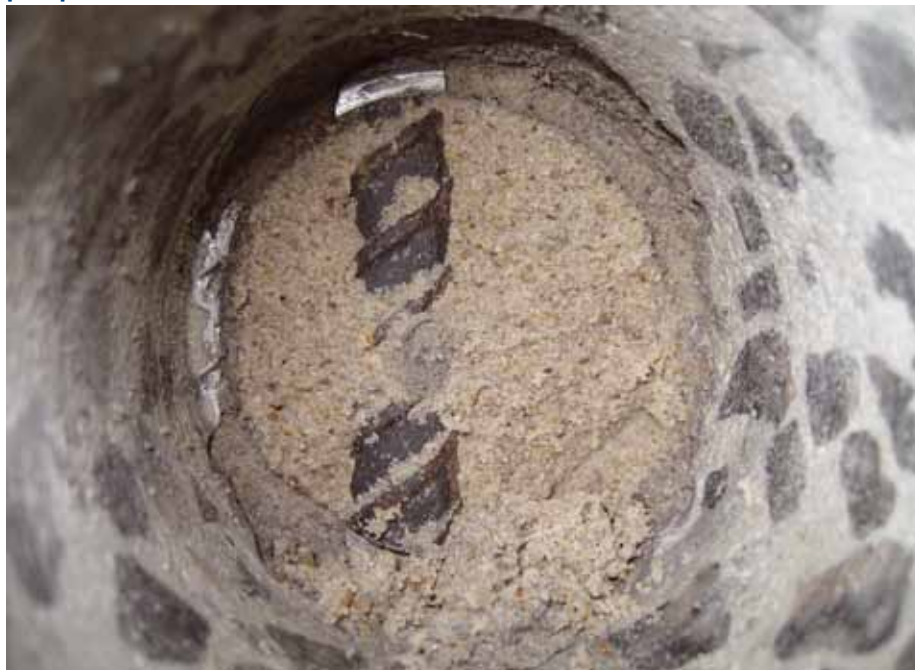
Kerneudboring i søjle viser separeret materiale i korrugeret rør, her usammenhængende sandlignende materiale

FORCE Technology har gennem de seneste år set en stigning i sager med korrugerede rør i nybyggeri med manglende eller dårlig udstøbning, hvorved byggeriet ikke opnår den tilsigtede stabilitet. Der er set fejlprocenter på op mod 20 %.