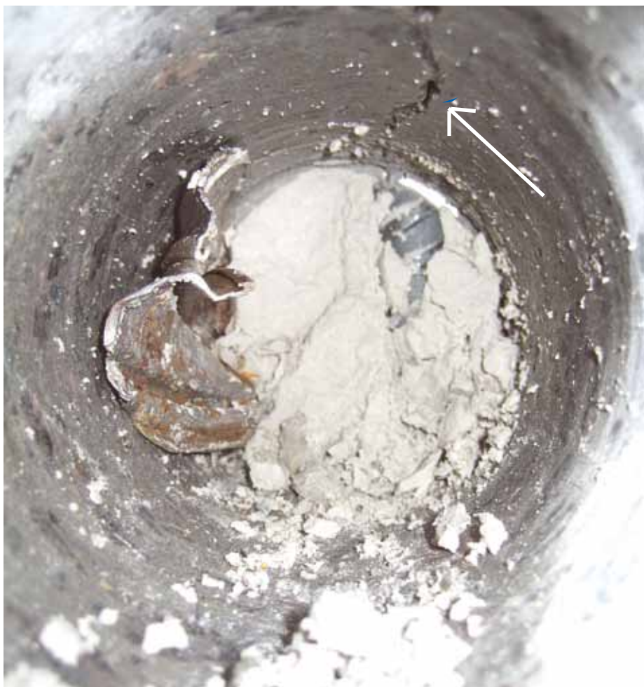
Keerneudboring i søjle viser separeret materiale i korrugeret rør, her cementpasta. Revnen er forårsaget af frostsprængning i det korrugerede rør.

For en specialist kan fejludstøbte rør i vægge nemt registreres. Søjler og sammenbyggede elementer kan også undersøges, det kræver dog større kendskab til, hvordan bølger reflekteres ved andre geometrier. Udover lokalisering af fejludstøbte elementer, kan der også foretages en afgrænsning af gode og dårlige områder på det enkelte element.