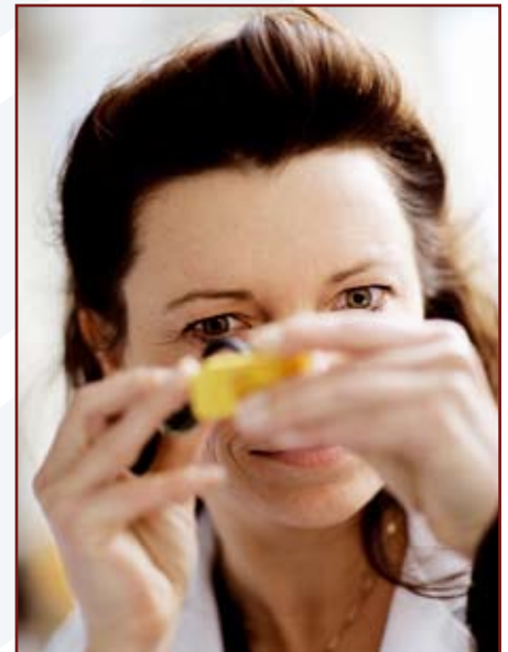
FORCE Technology undersøger smykker inden for en lang række områder

Der har på det seneste været stor fokus på sundhedsfarlige stoffer i smykker. FORCE Technology har bl.a. gennemført en undersøgelse af smykkemarkedet for Miljøstyrelsen, hvor det viste sig, at en del af smykkerne overskred de gældende regler.