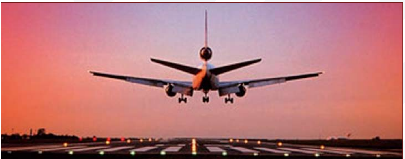
FORCE Technology hjalp Havarikommissionen med at finde årsagen til ulykken med SAS' flytype Dash 8, Q400