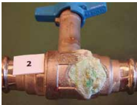
Gennemtæret ventil, der kun er et par år gammel

I områder med korrosivt vand kan små afspærringsventiler til vandinstallationer med fordel vælges i andre materialer, for eksempel rødgods, der har et højere indhold af kobber eller rustfrit stål.