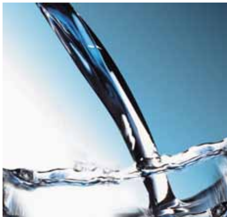
FORCE Technology skal undersøge nikkelafrigivelse fra vandhaner

Produkter til brug i kontakt med drikkevand skal have en lovpligtig VA-godkendelse, hvad angår de sundhedsmæssige